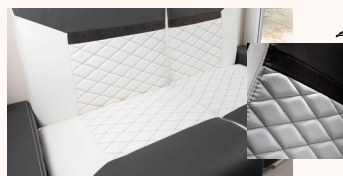
Møbelstoff Prestige (Ekstrautstyr)